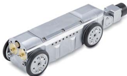
▲ Connettore telecamera 1 ▲ Connettore telecamera 2 ▲ T66 senza connettore