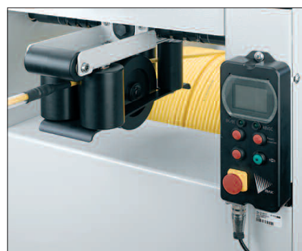
KW 505 con guida cavo automatica e visualizzatore della distanza