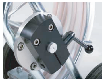
Freno dell'avvolgitore IBAK HSP